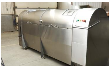
Machine à composter

Composter les déchets organiques permet de réduire les émissions de gaz à effet de serre contribuant aux changements climatiques, prolonger la durée de vie du site d'enfouissement, et produire un fertilisant naturel améliorer la croissance des plantes (jardins, aménagement paysager, potager, etc.).