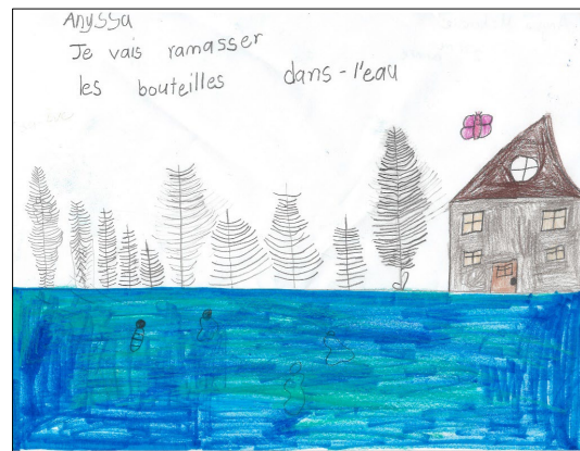
Anyssa Mckenzie 2 ième année (absente de la photo)

L'Écocentre tient à féliciter les gagnants ainsi que tous ceux qui ont participé.